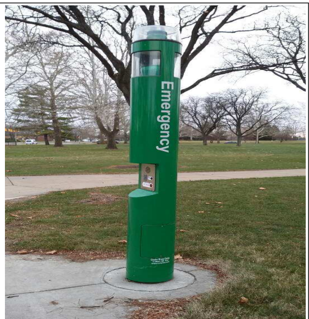
- 비상벨(붉은 버튼) 및 전화(측면모습)