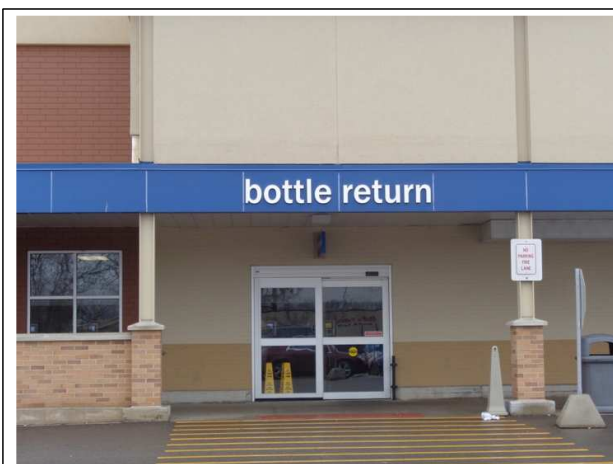
- 재활용품 반납실 입구