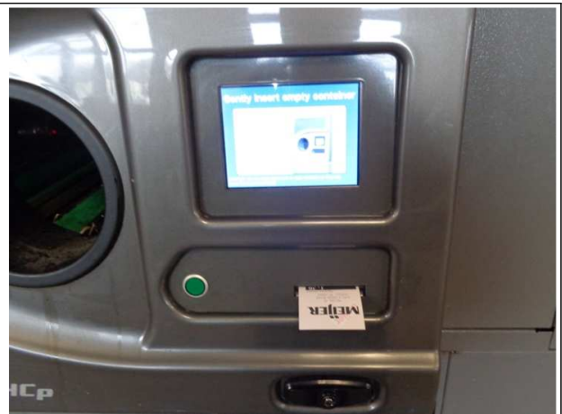
- 반납 완료 후 환불청구 증서(Meijer)