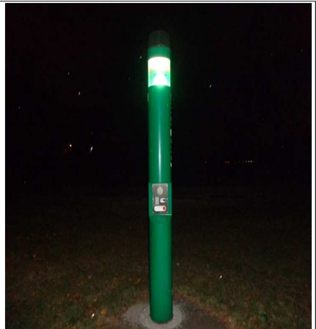
- 야간 위치 표시 및 보안등 역할