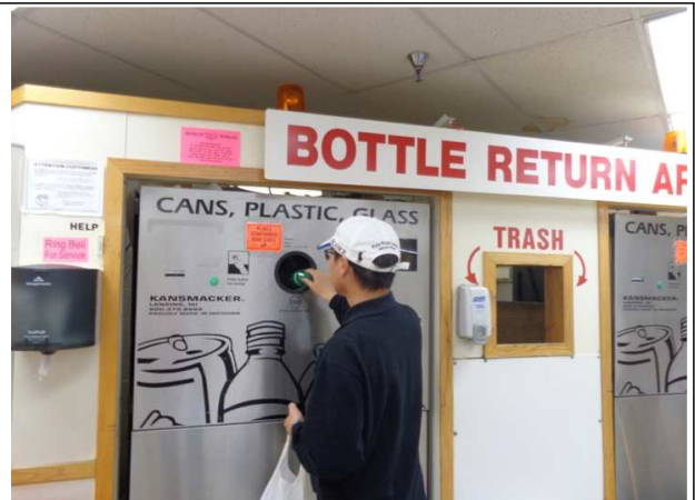
- 캔, 플라스틱, 병 반납 모습(Goodrich's)