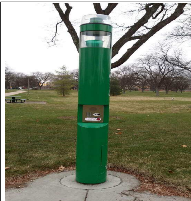
- 비상벨(붉은 버튼) 및 전화(정면모습)