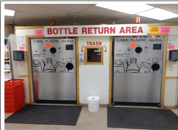
- 재활용품 반납기(Goodrich's 매장에 설치)