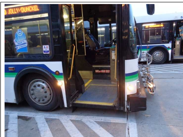
- 출입문 경사로가 펴지기 전 모습