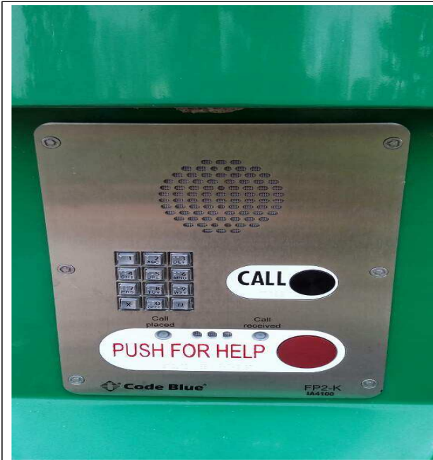
- 비상벨 및 비상전화 모습