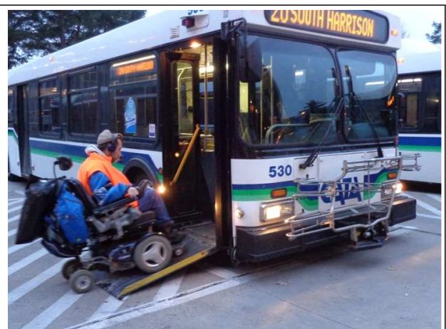
- 출입문 경사로 펴짐(전동 접이식) - 동시에 출입문 쪽으로 차체 기울어짐